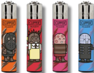
ENC.CLIPPER REUSABLE TERROR PIXEL X24U