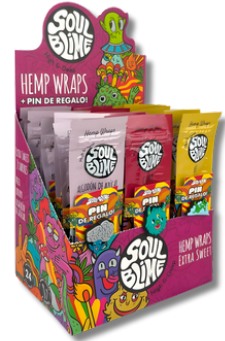
DISPLAY EXTRA DULCE SOULBLIME BLUNT X24 SACHET