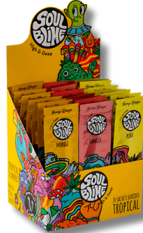
DISPLAY TROPICAL SOULBLIME BLUNT X24 SACHET