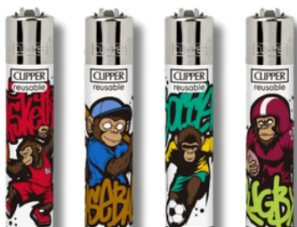
ENC.CLIPPER JET FLAME MOTIVOS X24U