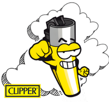
GAS BUTANO DE BOLSILLO CLIPPER 16ML X25U