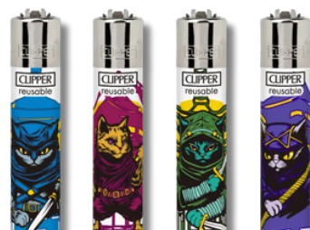
ENC.CLIPPER REUSABLE NINJA CATS X24U