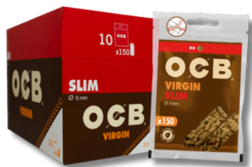
FILTRO OCB VIRGIN 10X150U