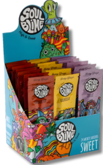
DISPLAY DULCE SOULBLIME BLUNT X24 SACHET