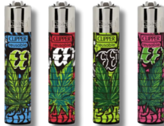
ENC.CLIPPER REUSABLE URBAN WEED X24U