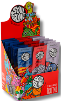
DISPLAY FRUTAL SOULBLIME BLUNT X24 SACHET