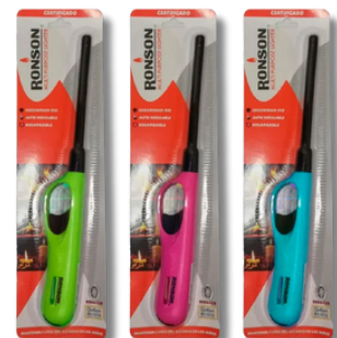
ENC. RONSON COCINA TUBO LARGO X1U