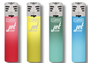
ENC.CLIPPER JET FLAME METALLIC X24U