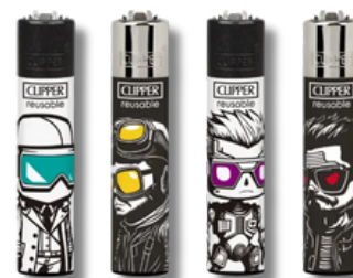
ENC.CLIPPER REUSABLE BIG HEADS X24U