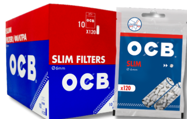
FILTRO OCB SLIM 10X120U