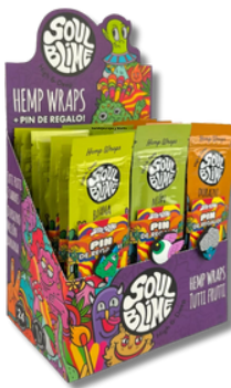
DISPLAY TUTTI FRUTTI SOULBLIME BLUNT X24 SACHET