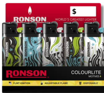
ENC. RONSON COLOURLITE HIPPIE X20U