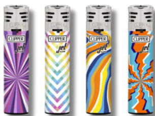
ENC.CLIPPER JET FLAME SPLASH X24U