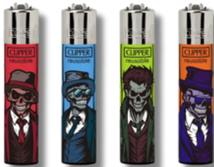
ENC.CLIPPER REUSABLE ZOMBIE GANGSTERS X24U