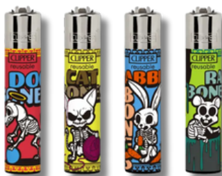
ENC.CLIPPER REUSABLE DEATH ANIMALS X24U