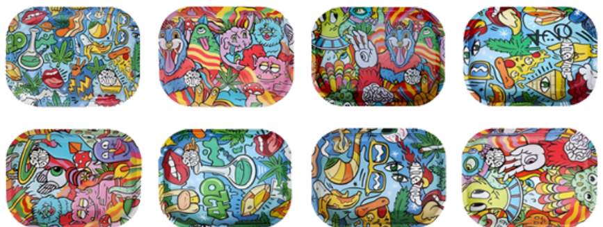
BANDEJA ILUSTRACION SOULBLIME UNIDAD