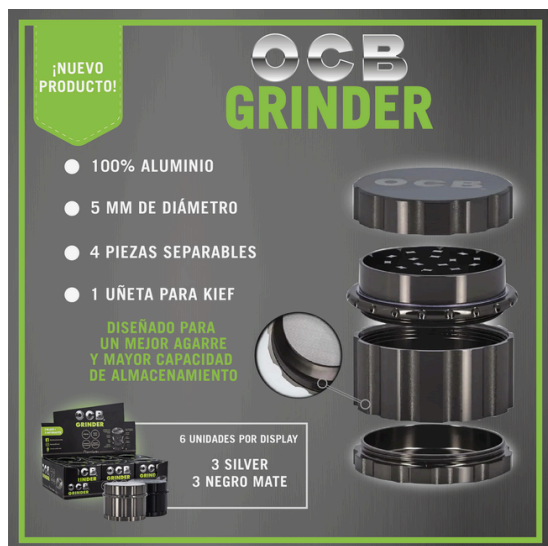
MOLEDOR ALUMINIO OCB 50MM X6 UNIDADES