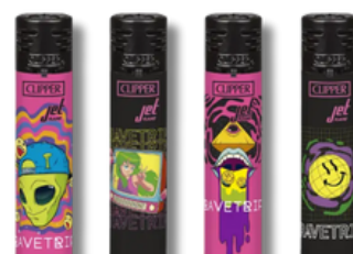
ENC.CLIPPER JET FLAME RAVETRIP X24U