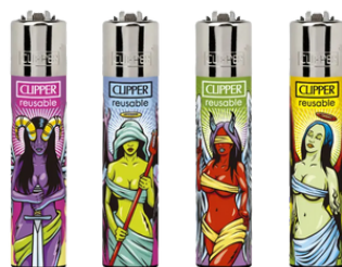
ENC.CLIPPER REUSABLE ANGELS VS DEMONS X24U