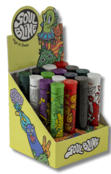
DISPLAY TUBO CONTENEDOR SOULBLIME X16U