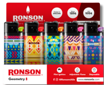
ENC. RONSON COLOURLITE X20U (GEOMETRY)