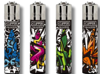
ENC.CLIPPER REUSABLE WEEDELEMENTS X24U