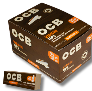
TIPS OCB VIRGIN 25X50U