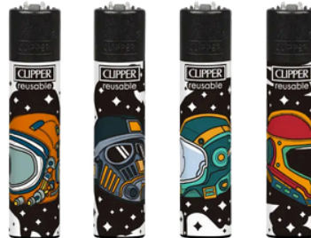
ENC.CLIPPER REUSABLE SPACE HELMETS X24U