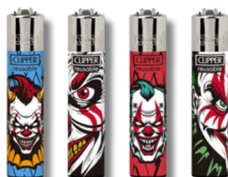
ENC.CLIPPER REUSABLE LOVELY CLOWNS X24U