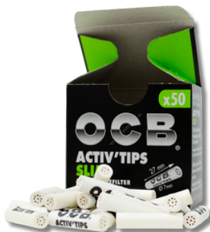
FILTRO OCB CARBON PREMIUM X50U