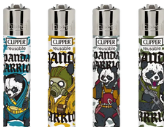
ENC.CLIPPER REUSABLE PANDA WARRIOR X24U