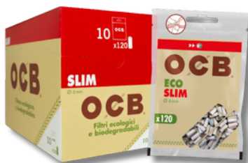
FILTRO OCB ORGANICO 10X120U