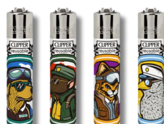
ENC.CLIPPER REUSABLE PILOT ANIMALS X24U