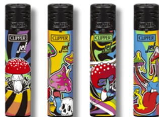
ENC.CLIPPER JET FLAME RAINBOW MUSH X24U