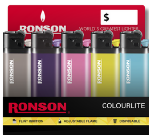
ENC. RONSON COLOURLITE X20U (SOLIDO)