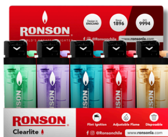
ENC. RONSON CLEAX20U (TRANSPARENTE)