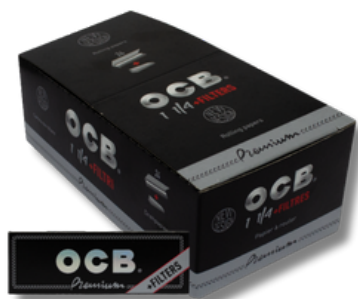
PAPEL + TIPS OCB NEGRO PREMIUM X24U