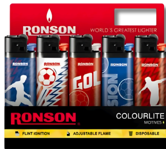
ENC. RONSON COLOURLITE X20U (FOOTBALL)